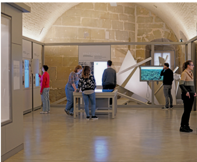
La Haus der Geschichte Baden-Württemberg a réouvert le musée en 2022 doté d'un dispositif multimédia et d'une nouvelle mise en scène.