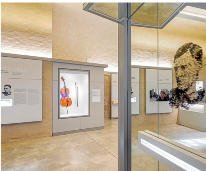
Le lieu de mémoire montre quelques-uns des rares objets de Claus Schenk Comte de Stauffenberg qui ont pu être conservés.