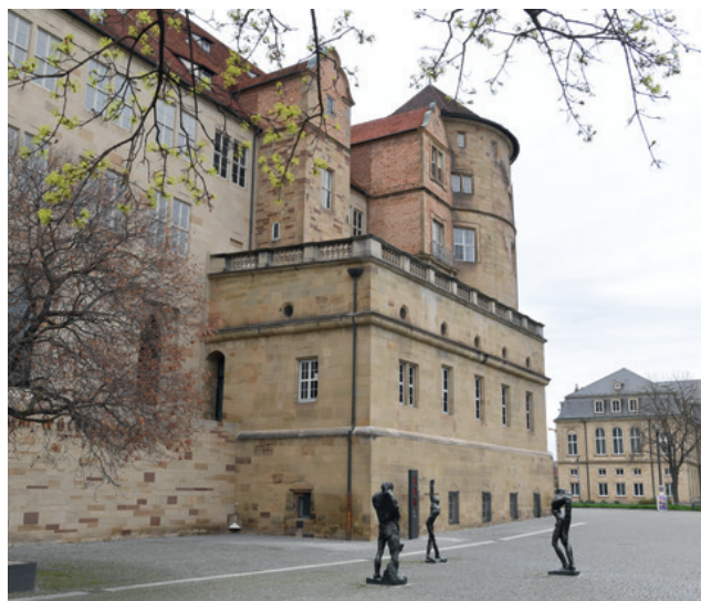
Le mémorial de Stauffenberg et sa nouvelle exposition sont installés dans le bâtiment des archives du Altes Schloss à Stuttgart.

L'exposition invite le visiteur à se constituer une idée propre de la personne de Stauffenberg et de l'attentat. Elle montre à quel point sa personne ainsi que l'attentat furent différemment interprétés – et le seront encore, à différentes époques, par différents groupes et dans de nombreux pays. Le dispositif multimédia permet de prendre part activement aux sujets abordés par l'exposition.