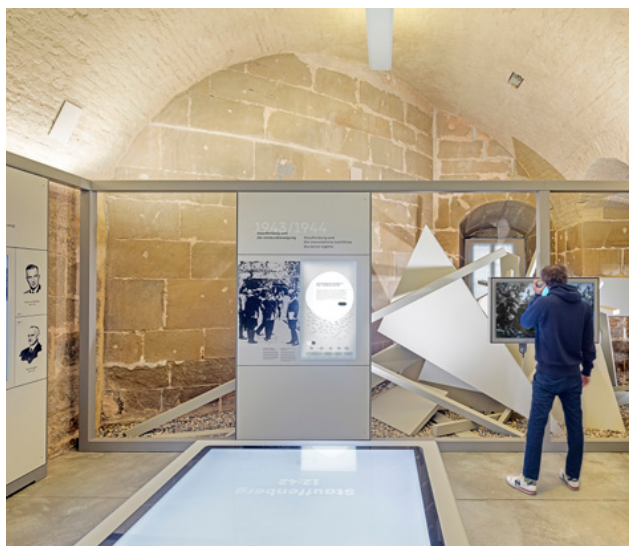
L'installation symbolise l'attentat perpétré le 20 juillet 1944 dans le quartier général du Führer Wolfsschanze.

L'exposition montre les actes et agissements de Stauffenberg à l'époque du National-Socialisme et sa transformation d'officier engagé et fidèle au système en une figure centrale de la résistance militaire contre le Nazisme. Elle aborde ainsi, sous plusieurs angles, le personnage de Stauffenberg et les motivations qui l'animaient.